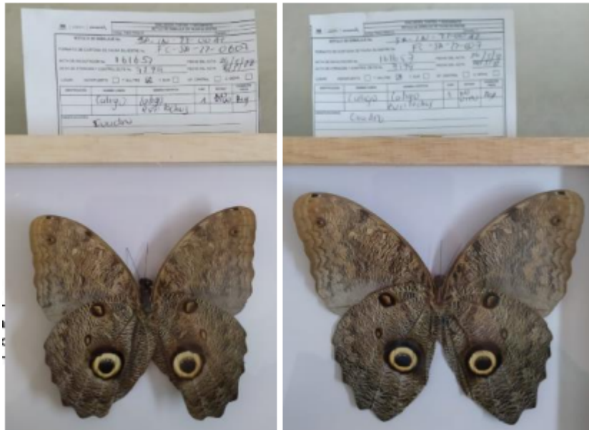
Fotografías 2, 3. Verificación de los productos pertenecientes a Caligo eurilochus (Mariposa búho) con rotulo SA-IN-22-0041 y SA-IN-22-0042 incautados. Acta Única de Control al tráfico ilegal de flora y fauna silvestre No. 161657.