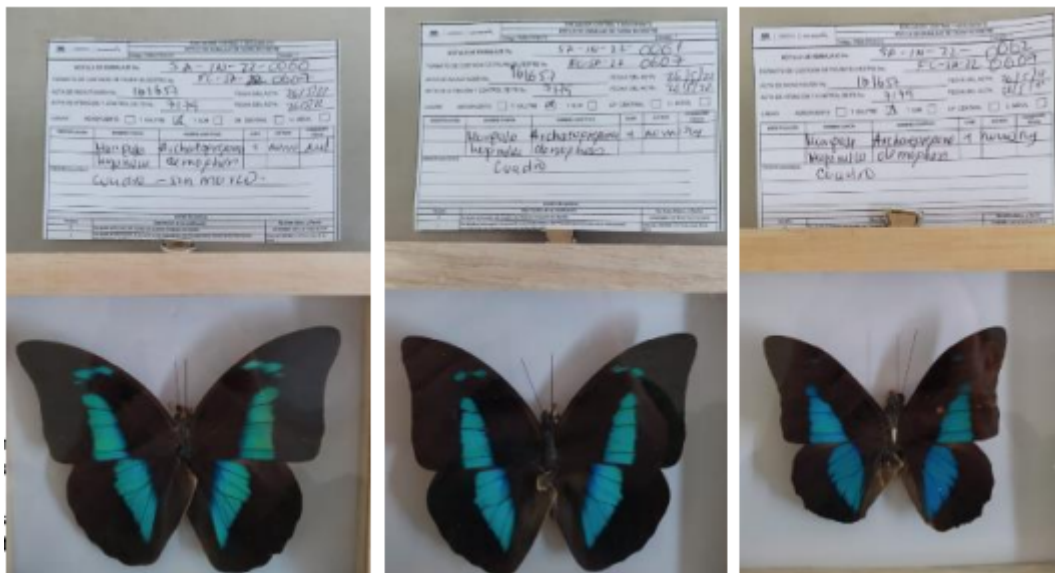
Fotografías 21 a 23. Verificación de los productos pertenecientes a Archaeoprepona demophon (Mariposa hojarasca) con rotulo SA-IN-22-0060 al SA-IN-22-0062. Acta Única de Control al tráfico ilegal de flora y fauna silvestre No. 161657.