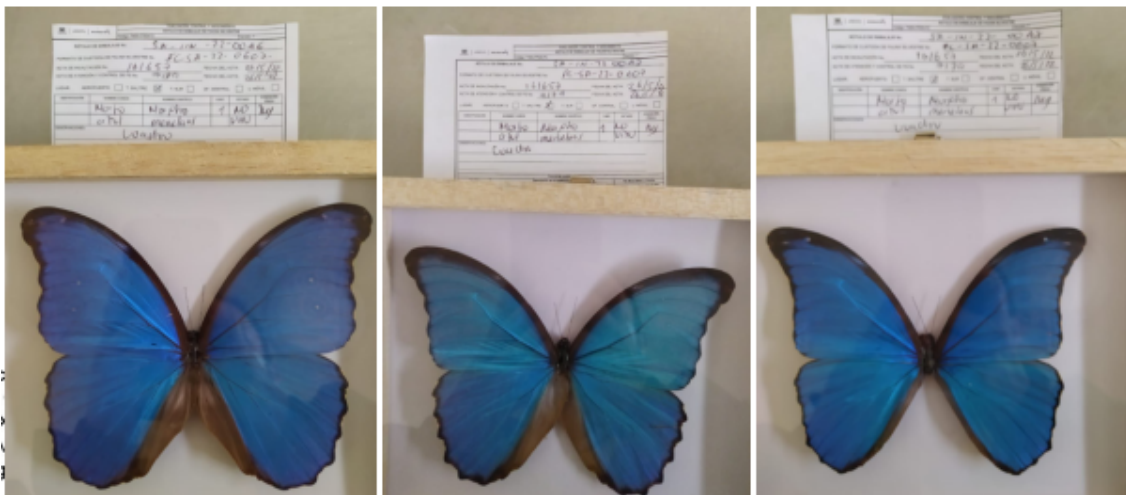
Fotografías 7 a 9. Verificación de los productos pertenecientes a Morpho menelaus (Morfo azul) con rotulo SA-IN-22-0046 al SA-IN-22-0048. Acta Única de Control al tráfico ilegal de flora y fauna silvestre No. 161657