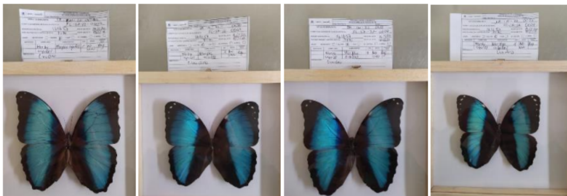
Fotografías 10 a 13. Verificación de los productos pertenecientes a Morpho achilles (Morfo Aquiles) con rotulo SA-IN-22-0049 al SA-IN-22-0052. Acta Única de Control al tráfico ilegal de flora y fauna silvestre No. 161657.