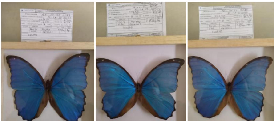
Fotografías 4 a 6. Verificación de los productos pertenecientes a Morpho menelaus (Morfo azul) con rotulo SA-IN-22-0043 al SA-IN-22-0045. Acta Única de Control al tráfico ilegal de flora y fauna silvestre No. 161657.