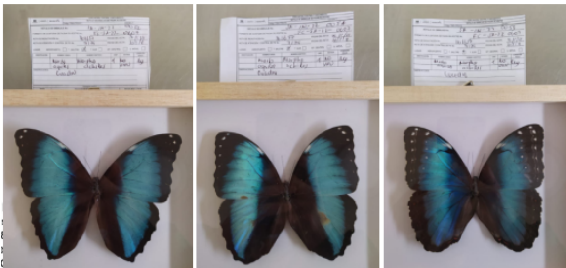
Fotografías 14 a 16. Verificación de los productos pertenecientes a Morpho achilles (Morfo Aquiles) con rotulo SA-IN-22-0053 al SA-IN-22-0055. Acta Única de Control al tráfico ilegal de flora y fauna silvestre No. 161657.